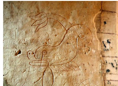
Représentation d'un animal marin, mur ouest, XVII ème -XVIII ème siècle.