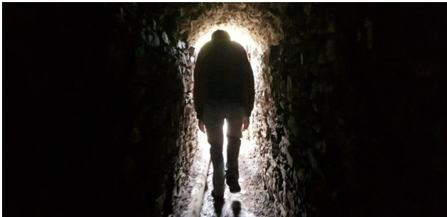
Souterrain médiéval, XIème siècle, Abbaye Saint-Vigor.

Le second qui se visite, servait à évacuer les eaux usées. En venant du sud-est, il récupérait les eaux des cuisines et des communs. Ces bâtiments, aujourd’hui disparus, occupaient le versant sud de l’Abbaye. Son accès se situe dans l’enceinte de l’Abbaye. C’est un tunnel étroit, d’environ quarante mètres de long, entièrement maçonné qui part du mur d’enceinte intérieure et débouche aux abords de l’étang aux Moines, sur le versant nord de l’Abbaye.