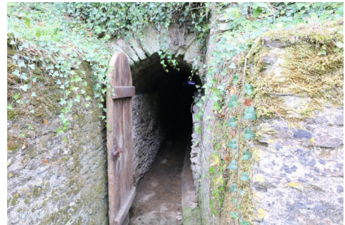
Sortie du souterrain, près de l’étang aux Moines.