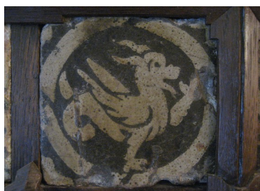
Pavés du Molay, XIV ème siècle.

L'activité, prévue sur une durée de deux heures, comprend :