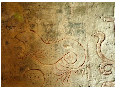
Caricature de Philippe Bourbon de Vendôme, mur ouest, XVIII ème siècle (v.1737).

Une partie de la salle basse qui abrite les collections muséales, a servi de cachot du milieu du XVI ème siècle jusqu'à la Révolution française. Les murs de cet ancien cachot sont ornés d'inscriptions et de gravures des XVII ème et XVIII ème siècles. Certaines de ces représentations, réalisées par les prisonniers, sont des caricatures des derniers Abbés de Cerisy.