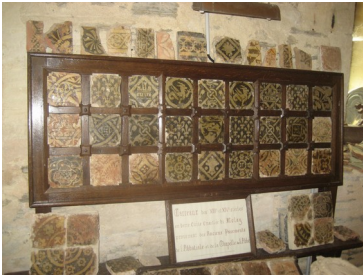
Vestiges de l'ancien pavage, XIV ème siècle.