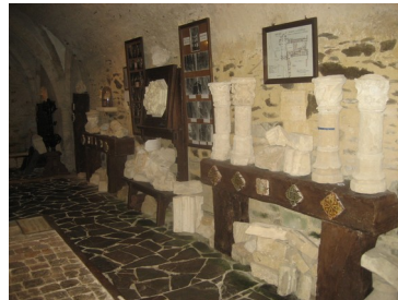
Vestiges de l'ancien cloître, XV ème siècle.

Une partie de la salle basse qui abrite les collections muséales, a servi de cachot du milieu du XVI ème siècle jusqu'à la Révolution française. Les murs de cet ancien cachot sont ornés d'inscriptions et de gravures des XVII ème et XVIII ème siècles. Certaines de ces représentations, réalisées par les prisonniers, sont des caricatures des derniers Abbés de Cerisy.